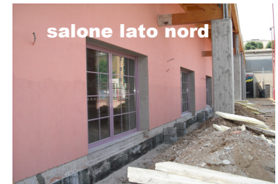
salone lato nord

Ancora per tutto questo si controllano le varie attrezzature esistenti: se sono in buono stato devono essere conservate; se sono in condizioni precarie, occorre programmarne per tempo l'acquisto (tavoli, sedie, armadi, scaffalature, attrezzature per giochi, aule, segreteria, cappella, salone, bar, cucina, depositi.