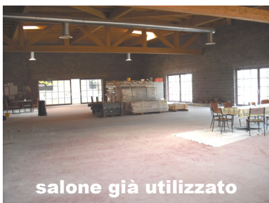
salone già utilizzato

(come, d'altra parte è stato fatto finora, dall'inizio dei lavori, in contemporanea anche ai