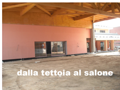
dalla tettoia al salone

potrà giungere non nel giro di un solo anno, ma entro un arco discreto di anni, dato che il pagamento delle successive rate potrà avvenire accedendo ad un