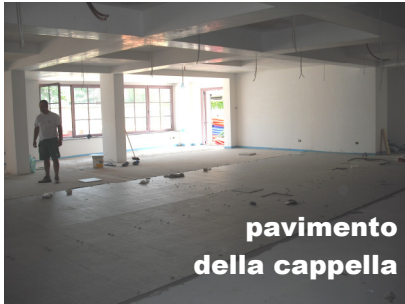
pavimento della cappella

E' bene però aggiungere una richiesta, anche se non c'entra direttamente con l'Oratorio, ma fa sempre parte della nostra Parrocchia, un richiesta che si riferisce alla Cappella da edificare nella nostra Casa di Riposo.