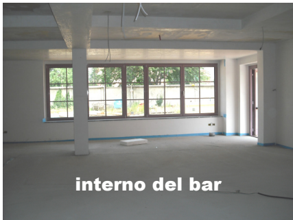
interno del bar

Dal momento che è venuto meno, inaspettatamente, un grande contributo (ormai dato per scontato a