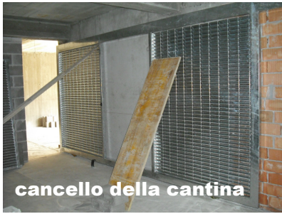
cancello della cantina