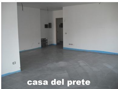
casa del prete

Questa è l'ultima rata che deve essere raccolta