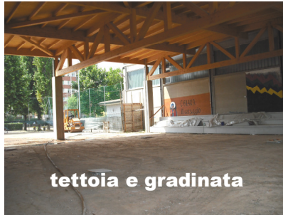
tettoia e gradinata

la "Prima Pietra" nell'occasione della Festa della Casa di Riposo, domenica 4 luglio).