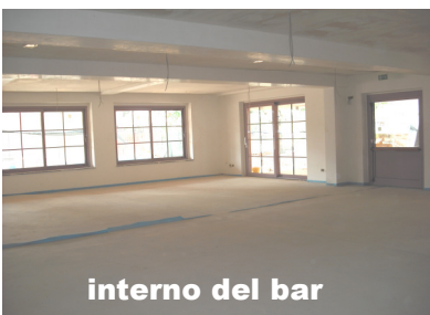
interno del bar

pagamenti mensili per i professionisti e altre spese occasionali per permessi vari). Questa generosità, va detto, è stata quella che ha permesso finora di rispettare con puntualità le scadenze precedenti e di questo ancora ringraziamo.