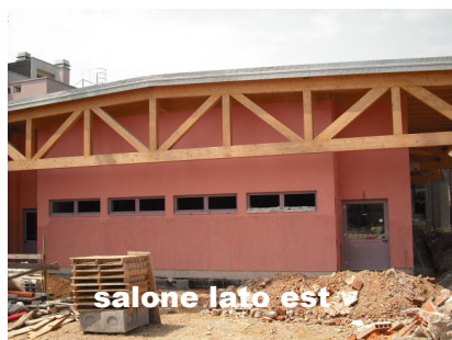
salone lato est

Poi sarà sempre indispensabile il vostro impegno, diversamente insostituibile, anche se l'aiuto