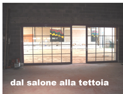
dal salone alla tettoia

La possibilità sono chiamate ad anticipare in queste settimane per contribuire, alla famosa "rata di fine giugno", quanto pensano di poter mettere da parte ed offrire nel mese di dicembre, (come hanno fatto negli anni scorsi). Vorrà dire che poi, per un po' di tempo potranno "tirare il fiato"