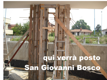
qui verrà posto San Giovanni Bosco

mente ed assumerne la responsabilità dal punto di