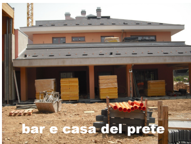
bar e casa del prete

E' chiesto a voi un ultimo grande sforzo: si dovrà "attingere" alla vostra generosità per la notevole rata di pagamento di fine