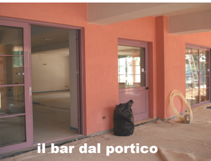
il bar dal portico

La richiesta è la seguente: le famiglie che hanno promesso al nostro Don Luigi di offrire, in un secondo tempo, un loro contributo o pensavano comunque di intervenire con generosità per questa opera, si sentano in questa occasione "esonerate" dal-