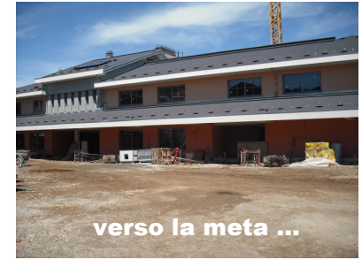
verso la meta ...

Ormai si parla di "finiture", di forme, di colori, di materiali, di colori per pavimenti, rivestimenti, tinteggiature varie. Si valuta quando si può iniziare l'attività nella nuova struttura dell'Oratorio; per questo si parla di termine e chiusura del cantiere, di tempo adatto per il trasloco, in modo da non intralciare il regolare svolgimento dell'Oratorio Estivo o magari, anche se, in piccola misura, far vivere questo bel momento ai ragazzi nell'ultima parte dell'Oratorio Estivo.