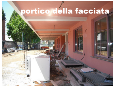
portico della facciata